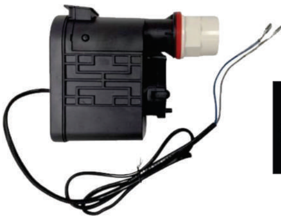
Bomba Válvula de descarte