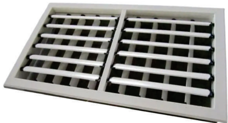
Grade Eólica Plástica | 45x65