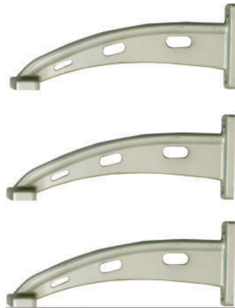
Haste do Motor