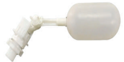
Boia de água