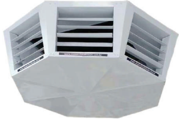
Difusor 6 Lados Alto