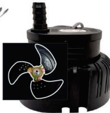
Bomba de água