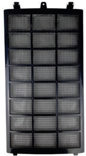
Filtro Anti Poeira